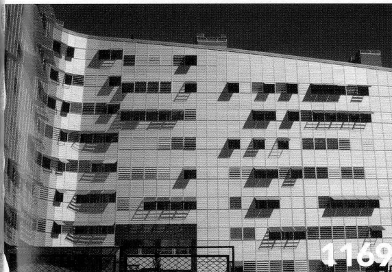
EDILIZIA PUBBLICA A MADRID